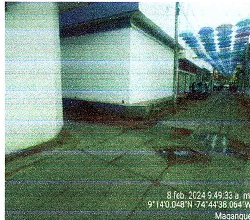
Figura N° 3 equipo CSB