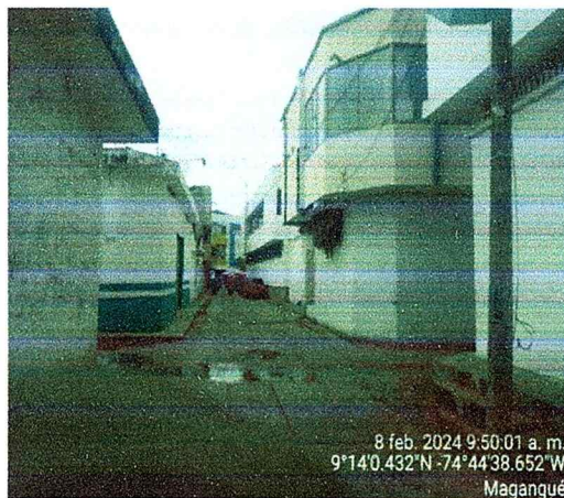
Figura N°2 equipo CSB